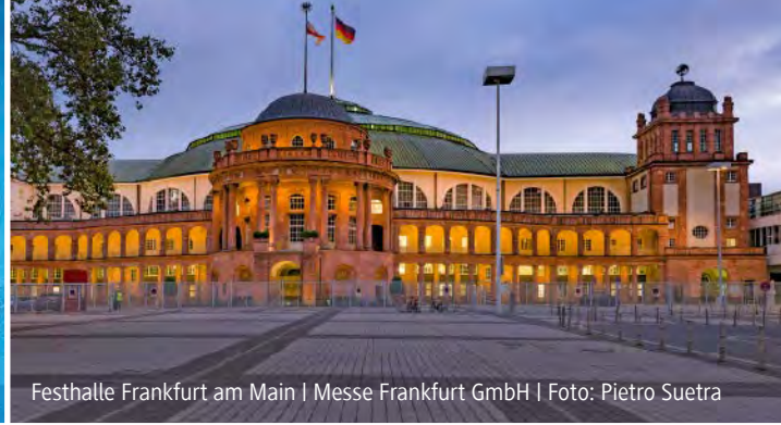
Festhalle Frankfurt am Main | Messe Frankfurt GmbH